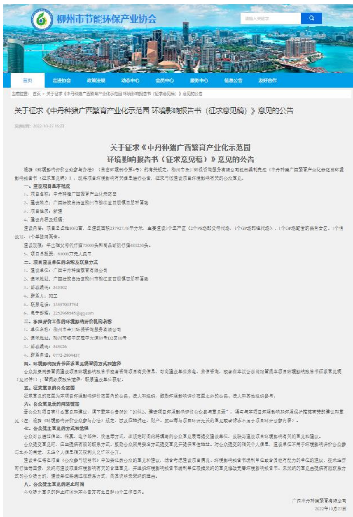
图 3.2-1 征求意见稿公示网页截图