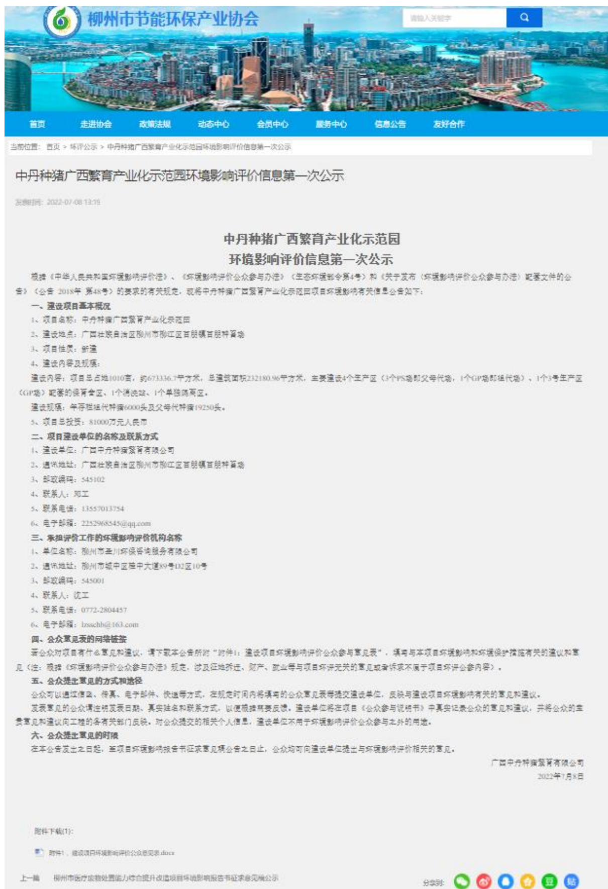
图 2.2-1 首次环境影响评价信息公开网页截图