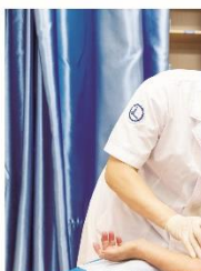
医生给患者把脉

中医药在妇幼保健领域具有独特优势。通过运用中医药理论和技术，可以有效预防和诊治妇科疾病，提高妇女的生殖健康水平。市妇幼保健院通过设立中医妇科门诊，为妇女提供个性化的中医药诊疗服务。